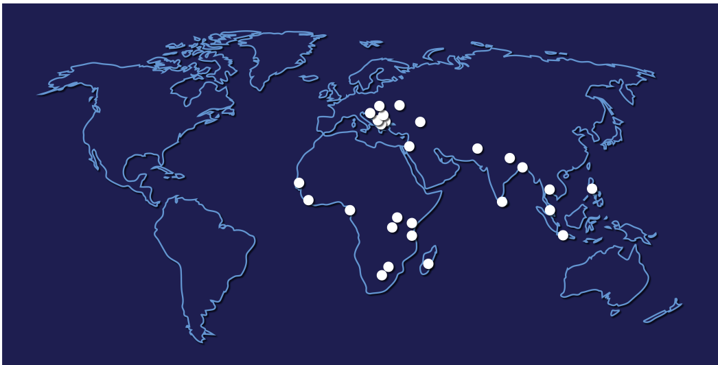
Мал 1. Антикорупційні суди у світі, 2022 рік

Країни, в яких існують спеціалізовані антикорупційні суди: Албанія, Вірменія, Бангладеш, Ботсвана, Бурунді, Камерун, Хорватія, Індонезія, Кенія, Мадагаскар, Малайзія, Чорногорія, Непал, Північна Македонія, Пакистан, Палестина, Філіппіни, Сенегал, Сербія, Сьєрра Леоне, Словаччина, Шрі Ланка, Танзанія, Таїланд, Уганда, Україна, Зімбабве.