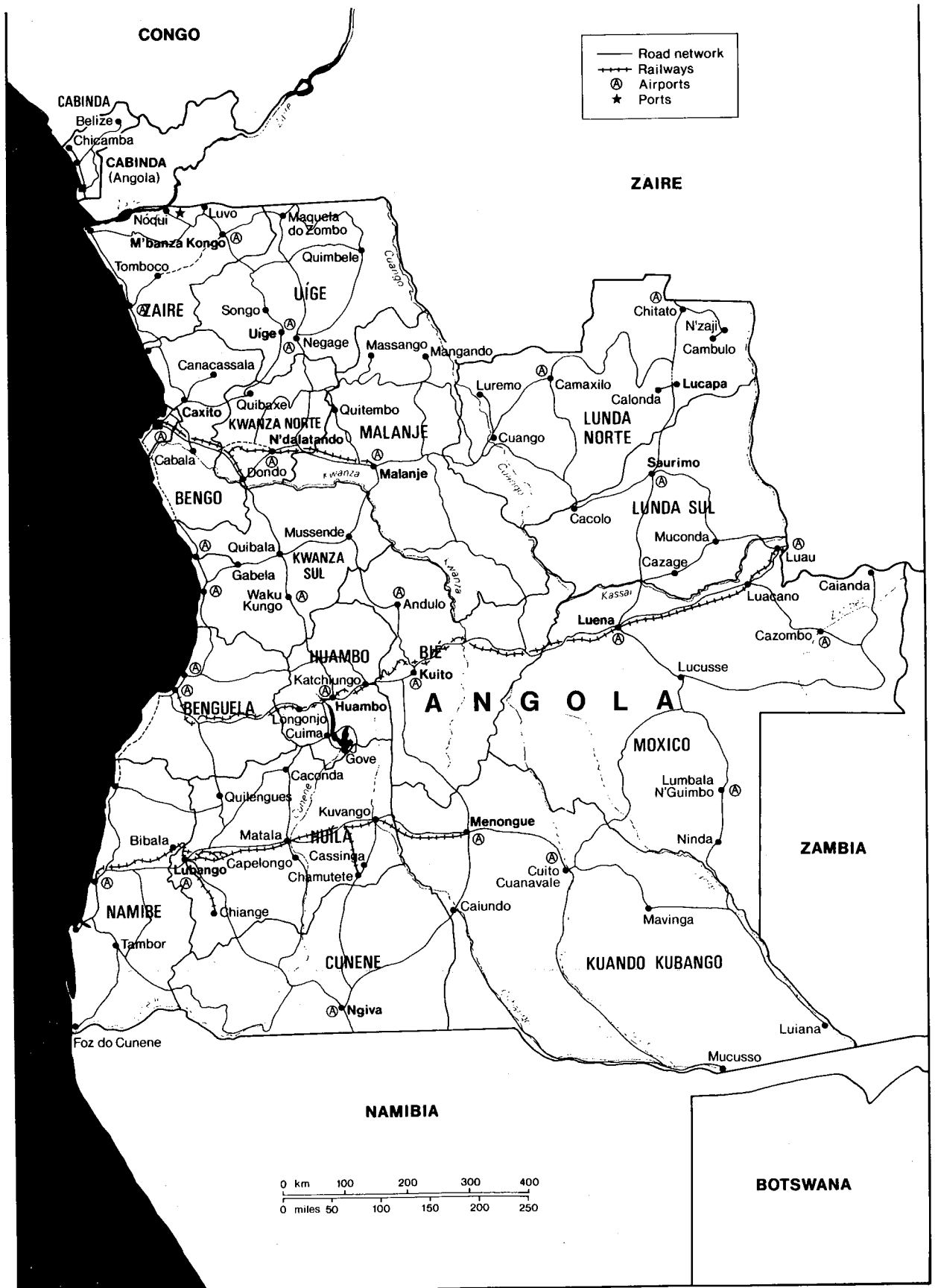
Figur 1 Kart over Angola